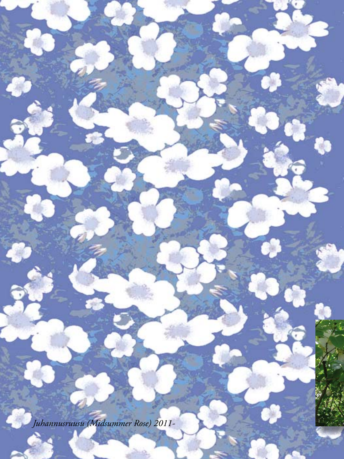
Juhannusruusu (Midsummer Rose) 2011-