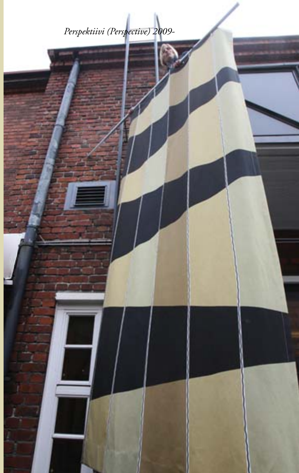
Perspektiivi (Perspective) 2009-