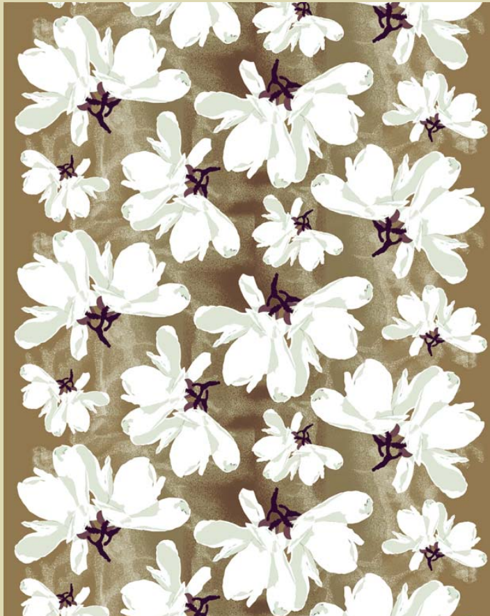
Kukkameri (Sea of Flowers) 2010-