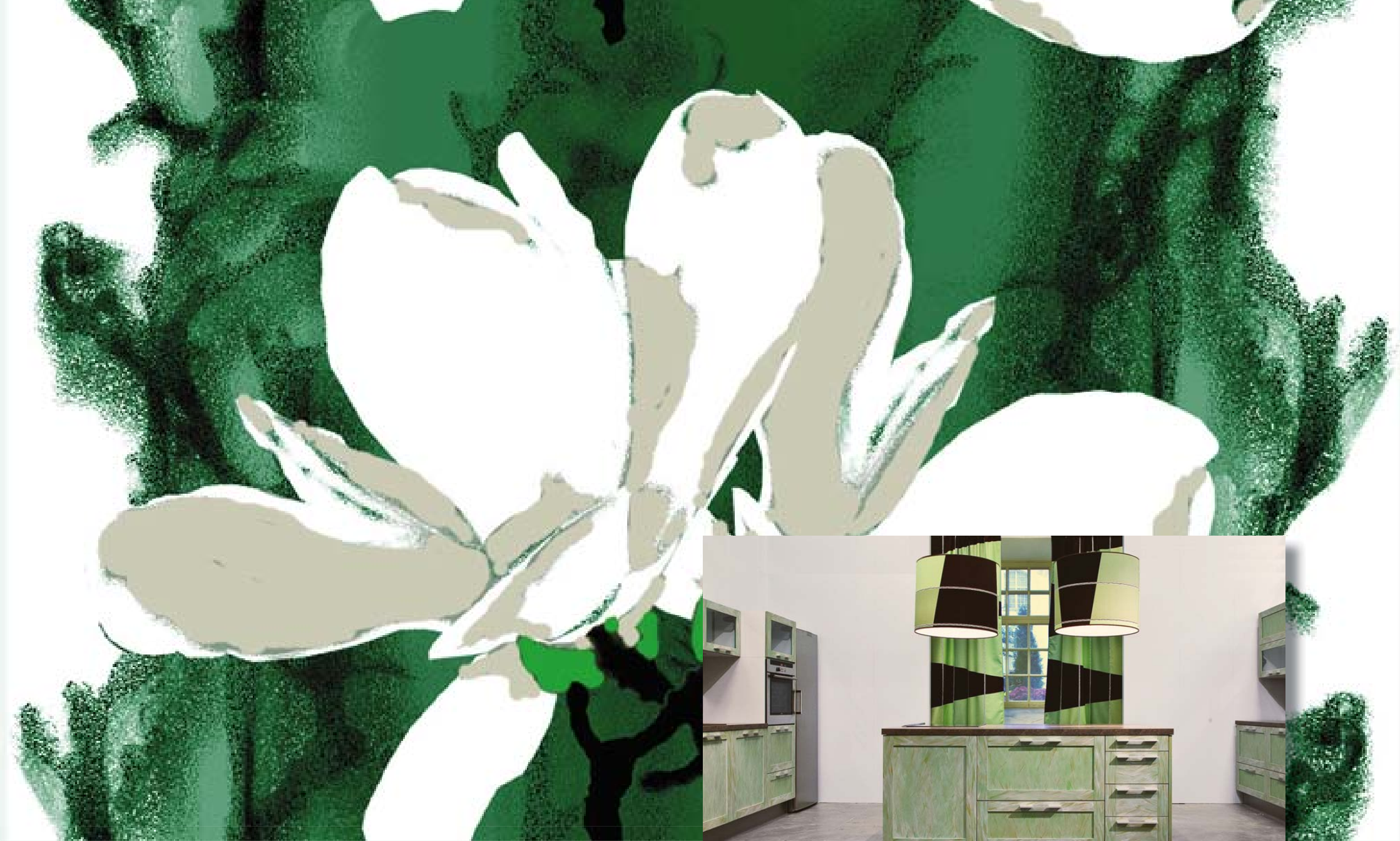
Talven kukka (Winter Flower) 2009-