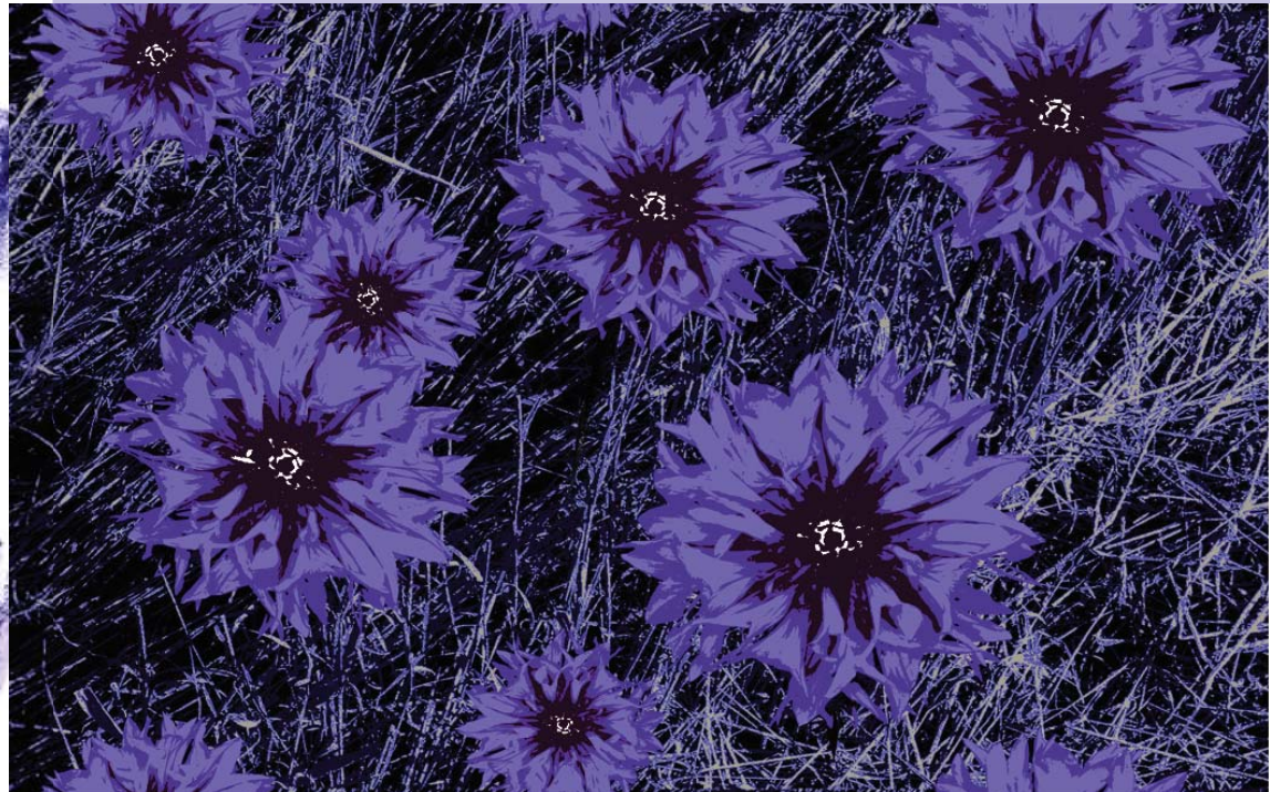
Ruiskukka (Cornflower) 2011-