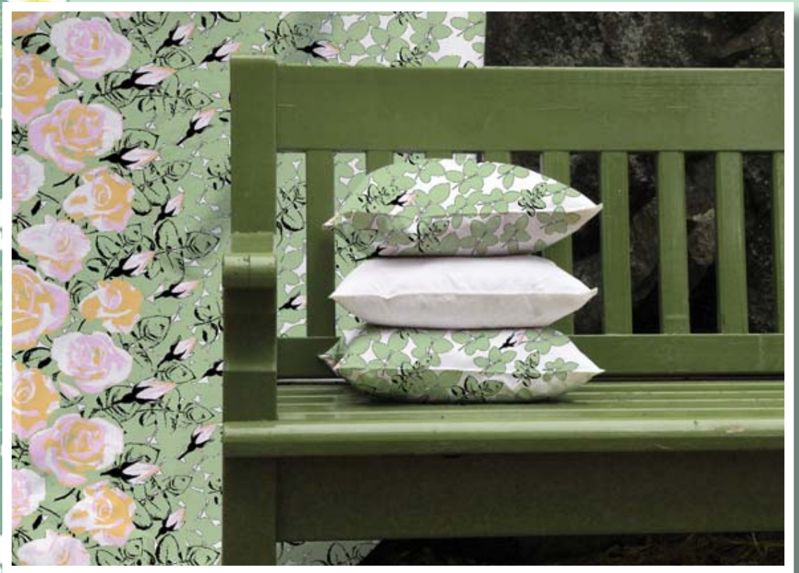
Ruusupuu (Rose Tree) 2010-