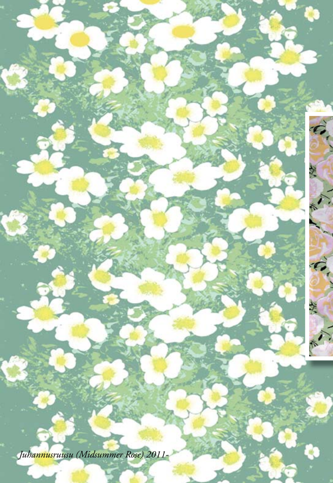
Juhannusruusu (Midsummer Rose) 2011-