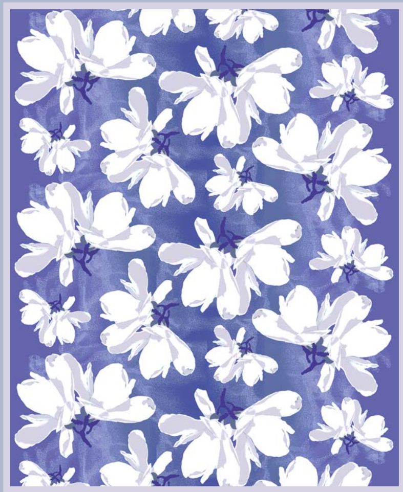
Kukkameri (Sea of Flowers) 2010-