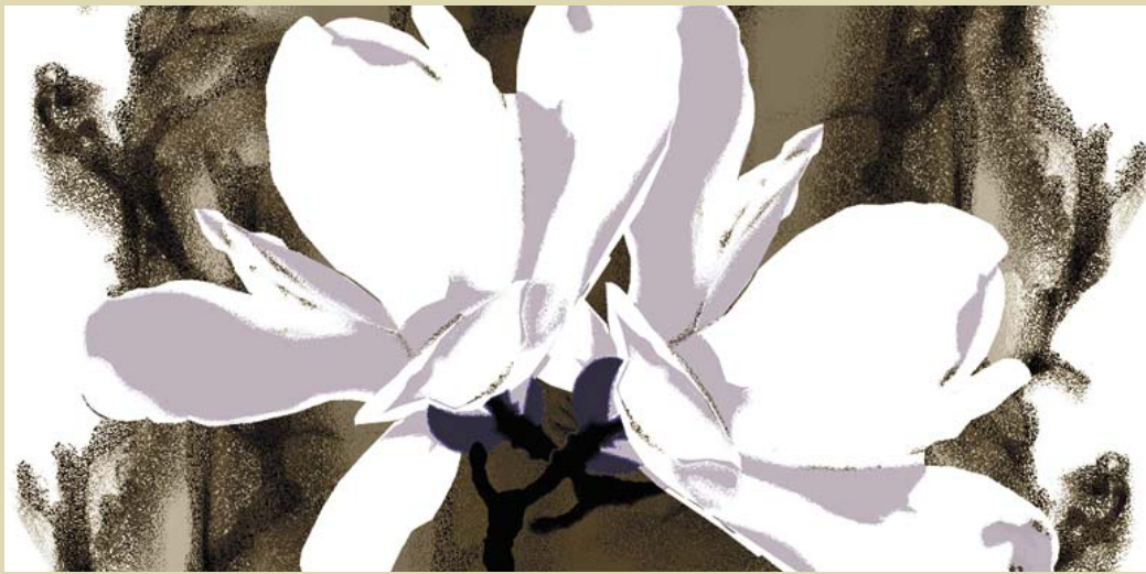
Talven kukka (Winter Flower) 2009-