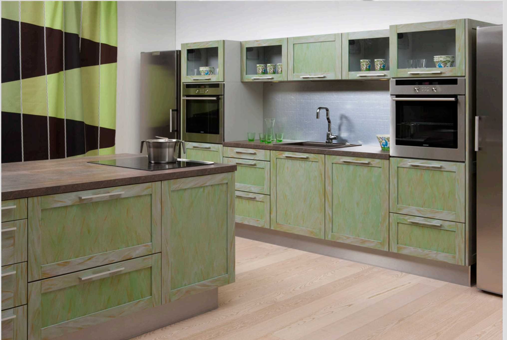
Piri & Puustelli keittiö; "Perspektiivi" verhokuusi suunniteltu Vallila Intderiorille 2009.